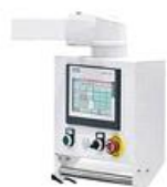
1. Пульт управления