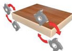
10. 2-х моторная обкатка углов (ROUND)