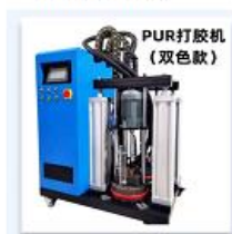
5. ПУР-станция на 2 вида клея