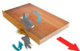
8. Узел фрезерования свесов (черновой)