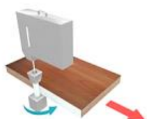
5. Верхняя клеевая занна с предплавителем