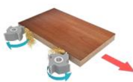
3. Узел предварительного фрезерования