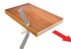
11. Узел радиусной циклевки R2