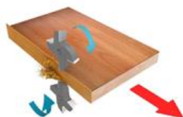
9. Узел фрезерования свесов (чистовой) R2