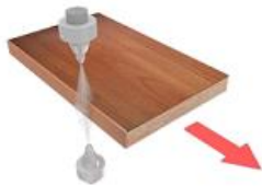
13. Подача очищающей жидкости