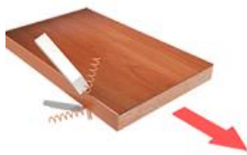
12. Узел плоской циклевки