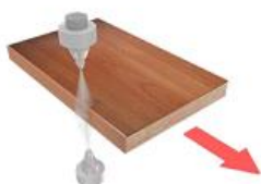
2. Подача разделяющей жидкости