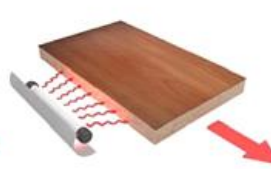
4. Лампа нагрева